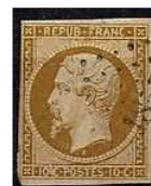
TIMBRE FRANCE Classique 1852 Type... 175,00 EUR