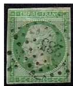
TIMBRE FRANCE Classique 1854 Type... 22,00 EUR