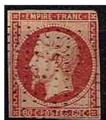
TIMBRE FRANCE Classique 1854 Type... 30,00 EUR