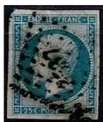
TIMBRE FRANCE Classique 1853 Type... 57,00 EUR