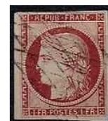
TIMBRE FRANCE Classique 1849 Type... 280,00 EUR