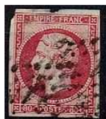
TIMBRE FRANCE Classique 1859 Type... 11,00 EUR