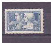
FRANCE NEUF SANS CHARNIERE N°2... 23,38 EUR