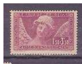
FRANCE NEUF SANS CHARNIERE N°256 16,50 EUR