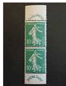
N188PAIRE 188 SEMEUSE 10c BAN... 26,05 EUR