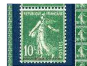
SEMEUSE 10c VERT TYPE 4 roulette de 11... 69,00 EUR